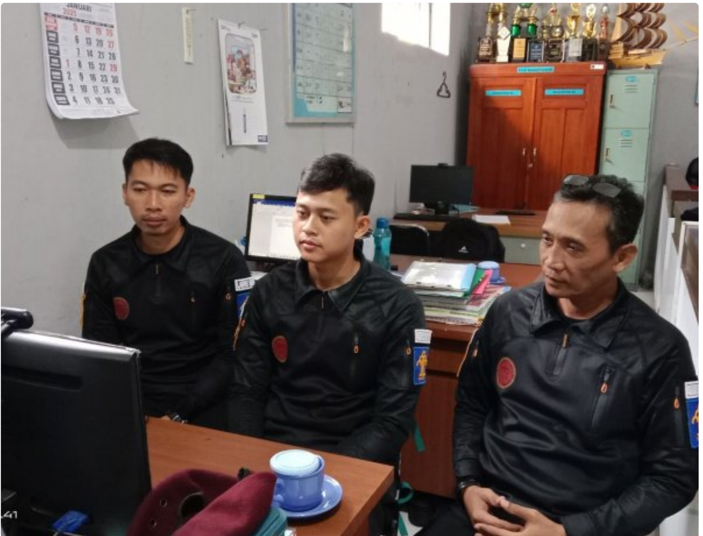
Bangun Harmoni dan Strategi, Lapas Besi Ikuti Webinar Refleksi Akhir Tahun 2024 & Resolusi 2025

CILACAP – Sebagai salah satu langkah dalam pengembangan kompetensi bagi